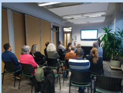
Invités à la présentation orale des travaux du Comité syndical Équipes-cours.